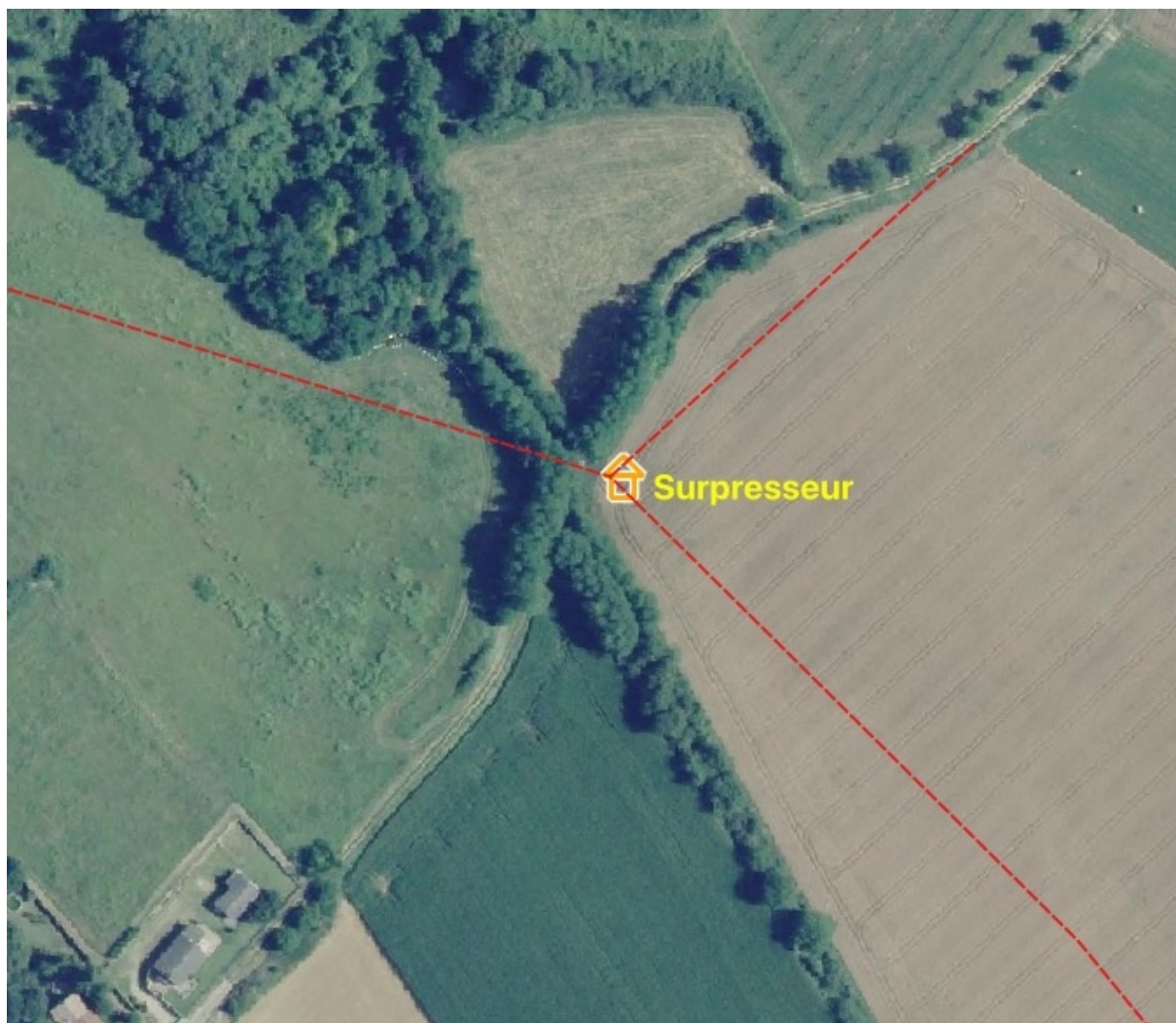
Localisation du surpresseur, à l'angle d'une grande parcelle de culture, côte de Toisieu, commune de Saint-Prim.