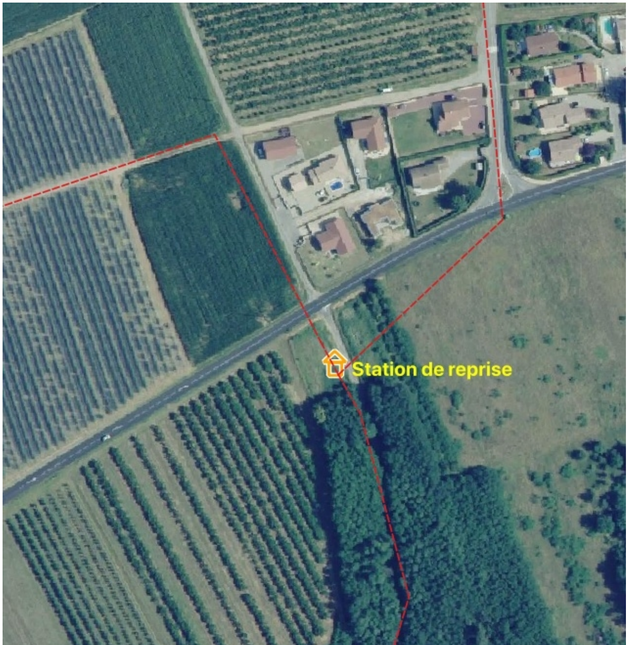
Implantation de la station de reprise sur une petite parcelle en bordure de vergers, secteur de « Sur Glay », commune de St-Prim.