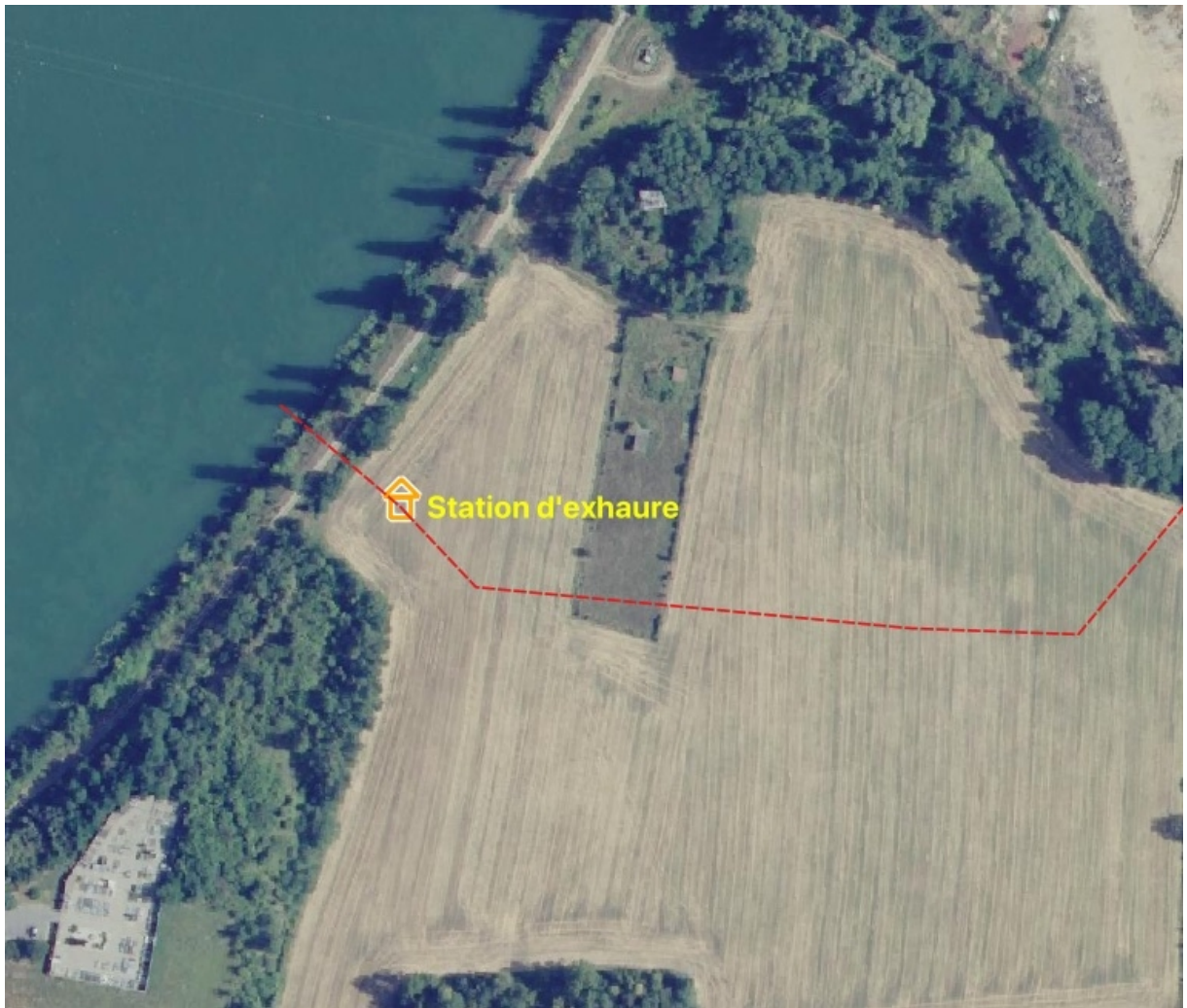
Localisation de la station de pompage principale (exhaure), en arrière de la digue du Rhône (parcelle de grande culture), au pied de la butte du cimetière de St-Alban-du-Rhône.